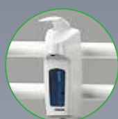
ESP , dávkovač dezinfekce na kolejnici, s objemem 0,5 l

Všechny vozíky mají rám ze speciálního plastu, jsou velmi lehké a snadno manipulovatelné. Sériově jsou všechny vozíky dodávány se 4 protáčivými plastovo-mosaznými koly o průměru 75 mm (2 kola jsou vždy brzditelná). To umožňuje snadnou pohyblivost a práci s vozíky.