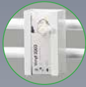
HSP , pevný zásobník na rukavice z lakovaného hliníku, namontovaný na kolejnici